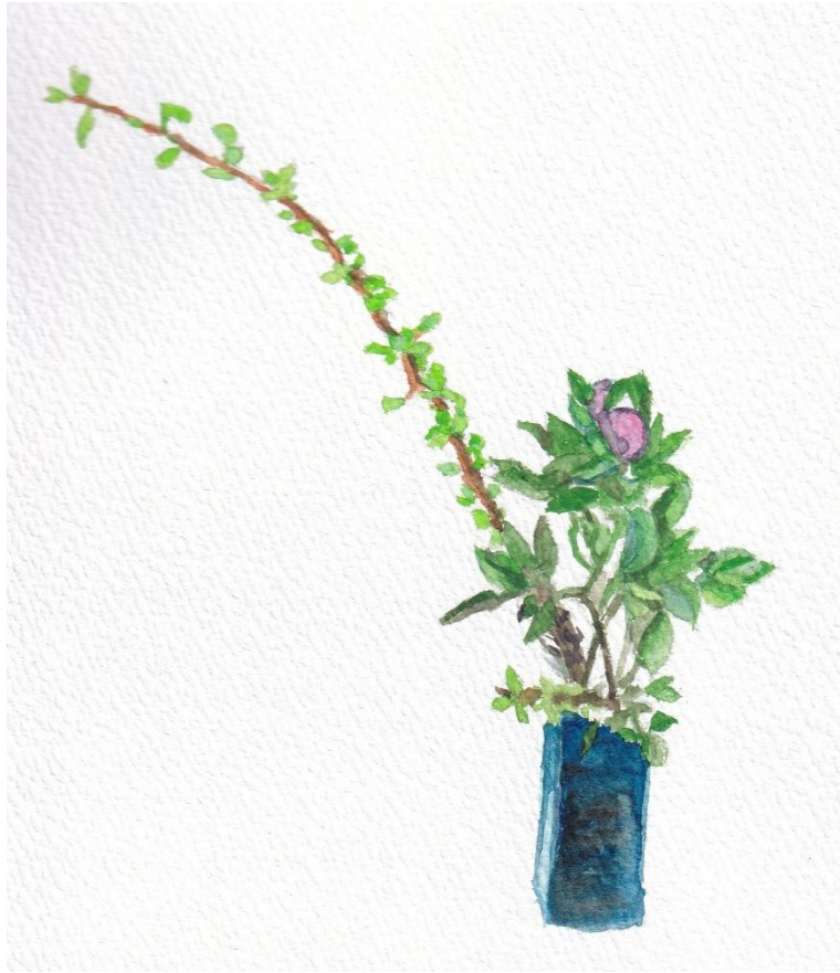
山村御流生け花 シャクヤク 画 山寄淑子